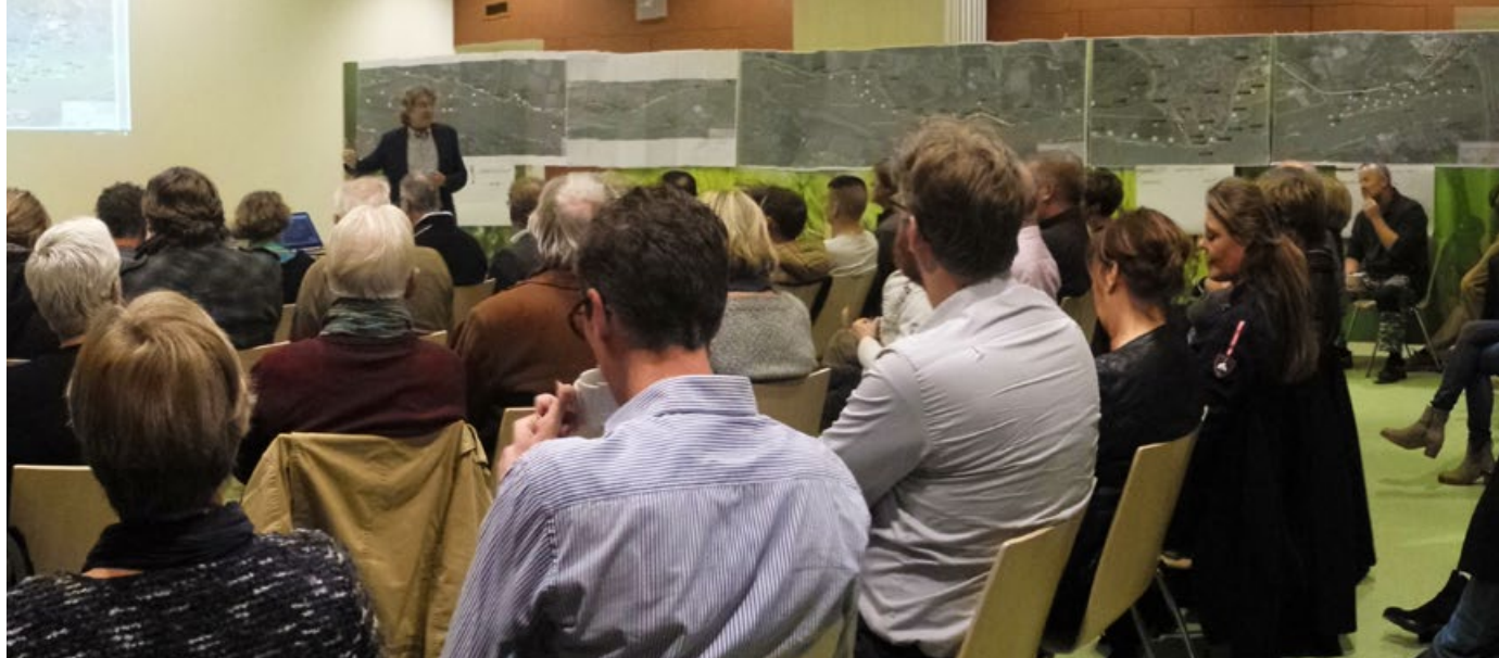
Belangstelling voor elkaars plannen tijdens de interne presentatie.