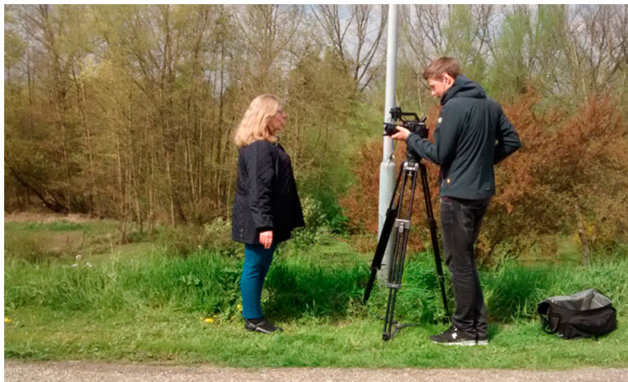
filmopnames voor videopitches

Het project dijkversterking Gorinchem - Waardenburg is onderdeel van het Hoogwaterbeschermingsprogramma (HWBP), een samenwerking tussen Rijkswaterstaat en de waterschappen. Omdat Nederland een ramp voor wil zijn, hanteren we strenge veiligheidsnormen voor onze dijken. Hierdoor staat het Hoogwaterbeschermingsprogramma de komende jaren aan de lat voor de grootste dijkversterkingsoperatie ooit. Het Hoogwaterbeschermingsprogramma is onderdeel van het Deltaprogramma.