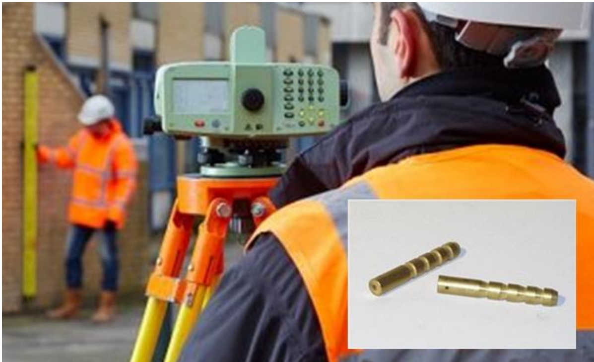
Figuur: Meting van zettingboutjes, zettingboutjes (inzet)