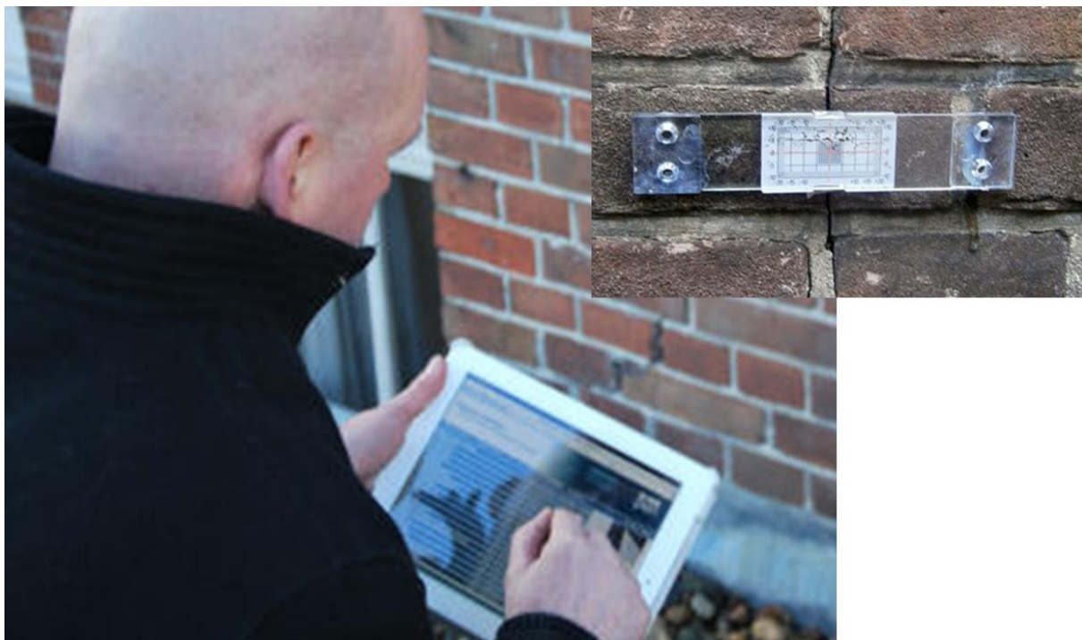
Figuur: Bouwkundige opname, scheurmeter (inzet)

Bij het schrijven van deze versie van het Monitoringsplan hadden nog niet alle eigenaren toestemming gegeven voor de bouwkundige opname. De eigenaren van woningen waar in 2021 al werkzaamheden worden uitgevoerd zijn aangeschreven met het dringende verzoek om toestemming te verlenen. Als er vooraf geen bouwkundige opname is gedaan, ligt de bewijslast voor schade door de uitvoeringswerkzaamheden bij de eigenaar.